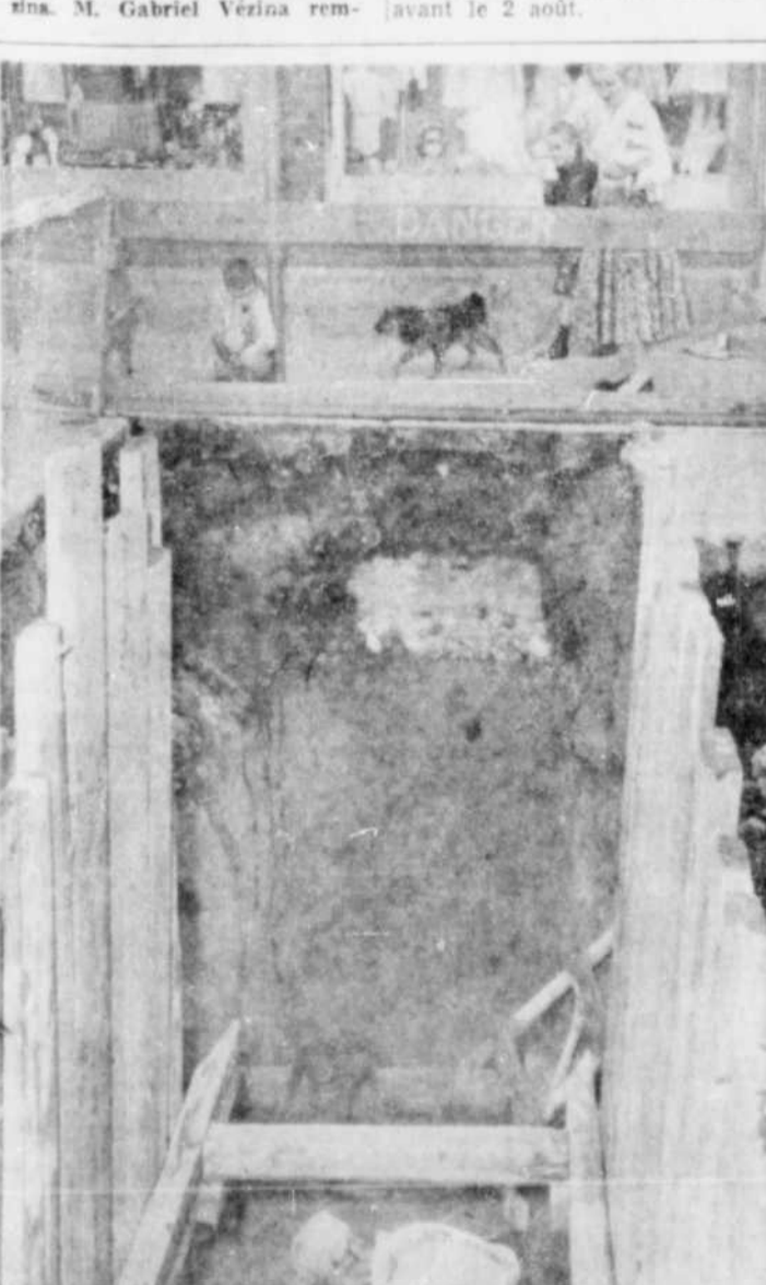
Sur LA 6e AVENUE, à Grand-Mère, des employés municipaux travaillent en ce moment le raccordement des égouts avec les édifices commerciaux.